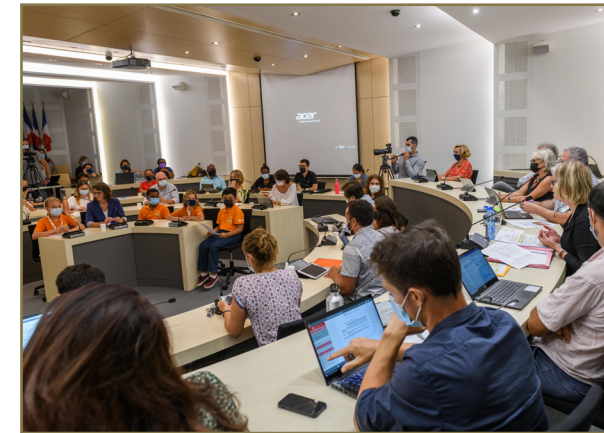
Les 4 juniors du CMJ au conseil municipal des adultes