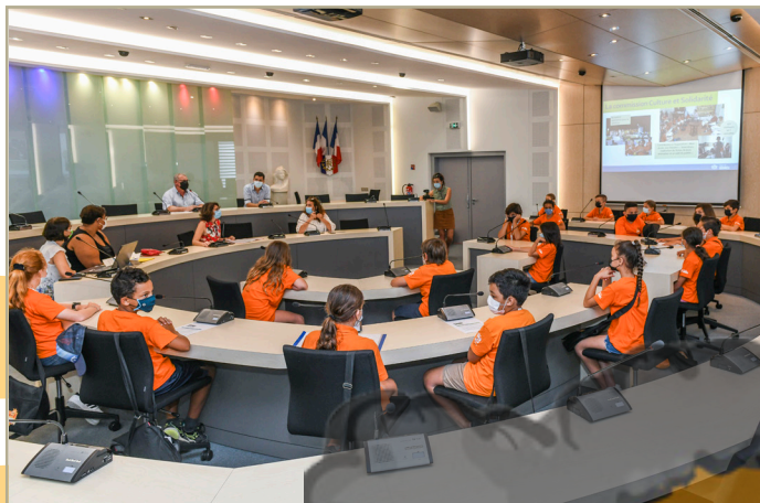
Séance plénière par commission