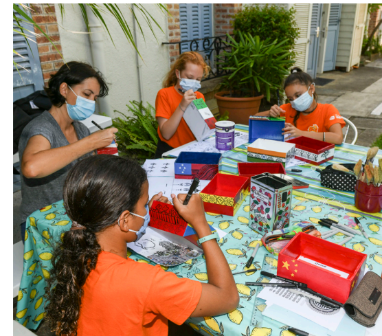
Atelier décoration dans les jardins