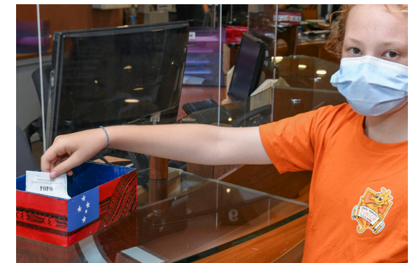
Une jolie boîte colorée pour déposer son ticket