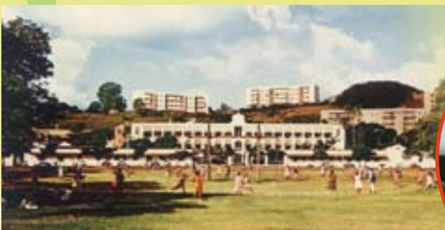
Cricket sur la place Bir Hakeim, 1960