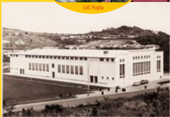
En 1970

« En 1964, lors de la visite du ministre Herzog pour la réalisation d'infrastructures en vue des Jeux de 1966, nous nous rendions à ce qui serait la piscine du Ouen Toro. En passant devant les terrains vagues, demi marécages, qui jouxtaient l'ancien vélodrome, le ministre me dit : « Vous ne savez pas où construire la salle omnisports ? Et pourquoi pas là ? » Ainsi fut choisi l'espace pour la salle omnisports de l'anse Vata. » Roger Kaddour