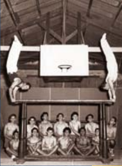
Cours de la Néo en 1950

La société de tir la Néo-calédonienne est fondée le 27 octobre 1880 par un arrêté du gouverneur Courbet. Elle devient en 1889 la Nouméenne. Deux lots de ville lui sont attribués par la municipalité rue Sébastopol où un dock est construit pour abriter les cours de gymnastique et d'escrime.