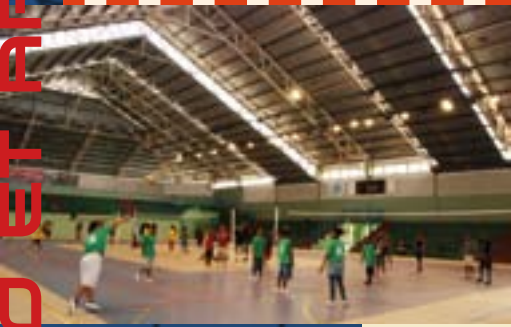
Salle de Rivière-Salée