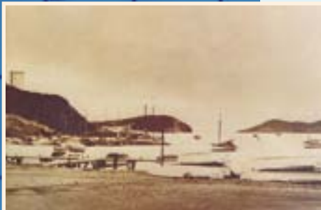
CNC en 1960