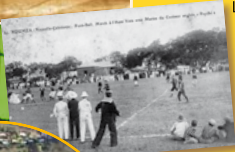
Vers 1910