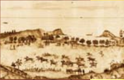
Gravure d'une course hippique à Nouméa en 1865, coll. Drain

Le 16 août 1865, à l'occasion de la fête de l'Empereur, une 1 ère course hippique est organisée à l'anse du Styx, (Baie des Citrons). Un comité des Courses calédoniennes, qui devient en 1872 le Jockey club calédonien, décide d'y programmer des courses annuelles de 1871 à 1879 avant de rejoindre l'hippodrome de Dumbéa.