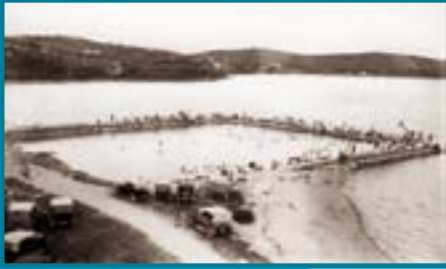
Les bains militaires dans les années 1920