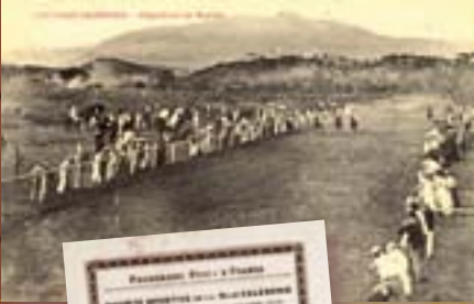
Hippodrome de Magenta dans les années 1900

Le 16 août 1865, à l'occasion de la fête de l'Empereur, une 1 ère course hippique est organisée à l'anse du Styx, (Baie des Citrons). Un comité des Courses calédoniennes, qui devient en 1872 le Jockey club calédonien, décide d'y programmer des courses annuelles de 1871 à 1879 avant de rejoindre l'hippodrome de Dumbéa.