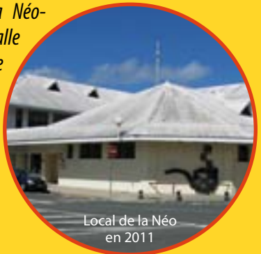
Local de la Néo en 2011

Il revient en Nouvelle-Calédonie où il décède le 10 novembre 1960.