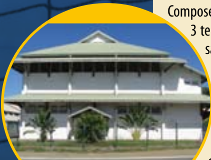
Maison des arts martiaux, salle Veyret à Rivière salée

Les arts martiaux tels que le judo, le karaté, le taekwondo y sont pratiqués.