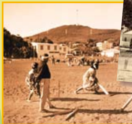
Vallée du Tir, 1950