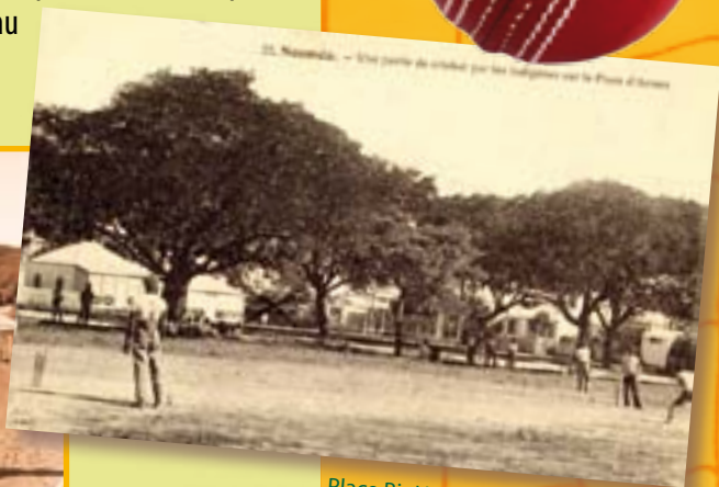
Place Bir Hakeim, 1910, coll. MDVN