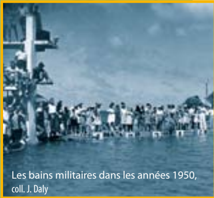
Les bains militaires dans les années 1950

Très endommagés par un cyclone en 1953, les bains sont « rafistolés » pour permettre l'entraînement aux Jeux de Suva (1963). En 1966, des piscines sont construites, les bains sont alors désaffectés.