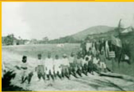
Course au vélodrome, 1910