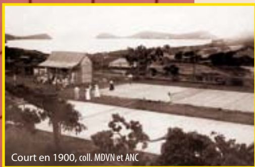
Court en 1900

Aujourd'hui, on compte 8 courts privés à Nouméa.