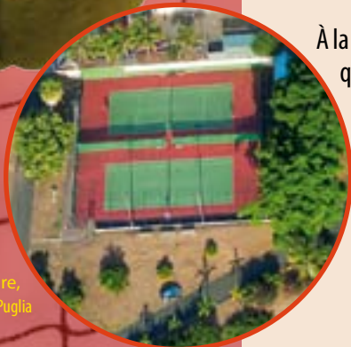
Court militaire, 2011