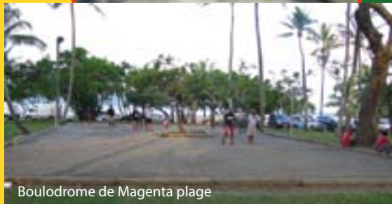
Boulodrome de Magenta plage

Géré par le service vie des quartiers de la ville, l'équipement comprend un terrain de jeux de boules.