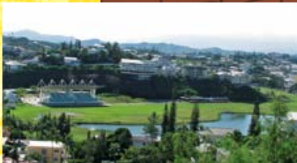
Hippodrome en 2011