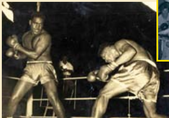
Combat de Doudi

Autrefois, les combats de boxe se disputaient souvent au ciné Hickson ou au vélodrome.