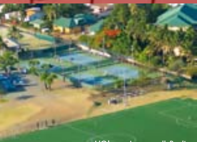
L'Olympique, coll. Puglia

En 1910, le Tennis Club du Mont-Coffyn s'agrandit. Aujourd'hui, il est composé de neuf courts de tennis dont 8 en gazon synthétique et un club-house. Le club compte 682 licenciés.