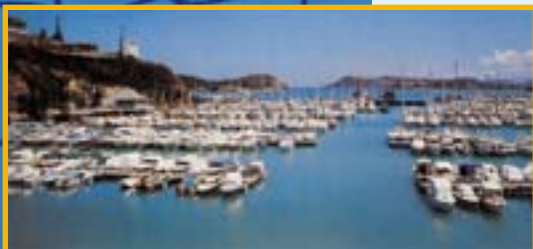
CNC en 1988, coll. CNC