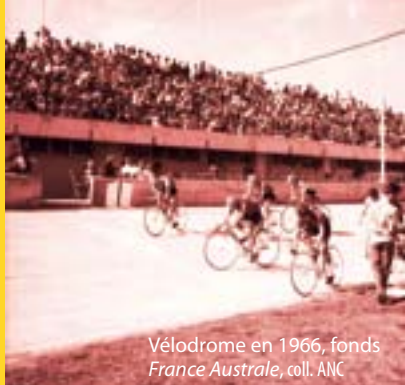
Vélodrome en 1966

Ouvert en 1998, le skatepark est composé d'une aire d'évolution pour les rollers et les skates, d'une rampe et d'un terrain de bi-cross.