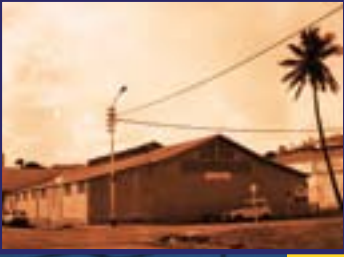
Local de la Néo