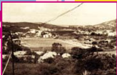
Vélodrome dans les années 1950

Apparu en 1870, en Nouvelle-Calédonie, grâce aux frères Albe et Gabriel Gaveau, le vélocipède rencontre rapidement de nombreux adeptes. En 1889, la course de vélo est inscrite au programme des festivités nationales, à l'hippodrome de Magenta. Harry Russ et Ernest Brock disputent la course. Deux ans plus tard, le Véloce Club Calédonien est créé.