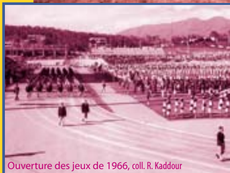
Ouverture des jeux de 1966