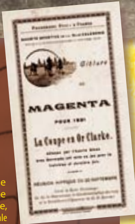
Programme de la coupe Clarke, coll. G. Viale

En 1880, une seconde société, la Société calédonienne de courses, se crée et organise ses courses à l'hippodrome de Magenta sur un terrain mis à disposition gracieusement par monsieur Adet. En 1942, les troupes américaines utilisent l'emplacement pour construire un aérodrome. L'hippodrome est alors installé à l'anse Vata.