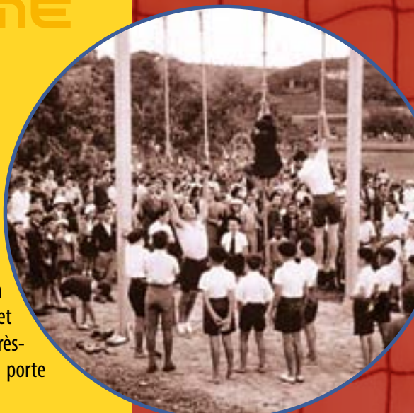
Inauguration du PLGC en 1938

Pendant les travaux, 150 tonnes de sable et 100 tonnes de caoutchouc ont été utilisées pour maintenir les fibres synthétiques du gazon.