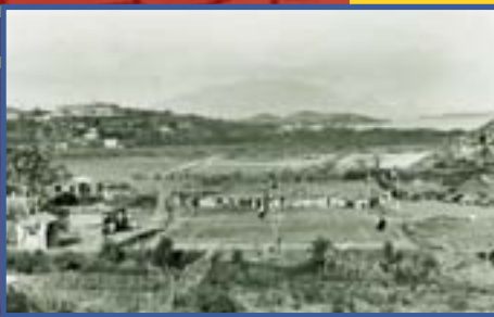
Stade Saint-Michel, 1930

Dès la fin du XIX e siècle, les courses à pied sont proposées lors des cérémonies officielles. Elles se déroulent dans les années 1900 au vélodrome de l'anse Vata.