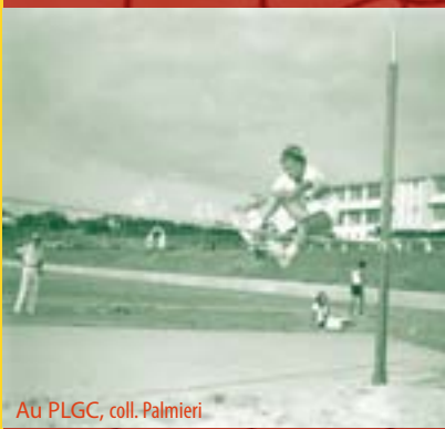
Au PLGC, coll. Palmieri